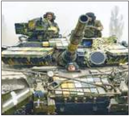
रूस में शहर में चल रहे टैंक, लोग घरों में दुबके।