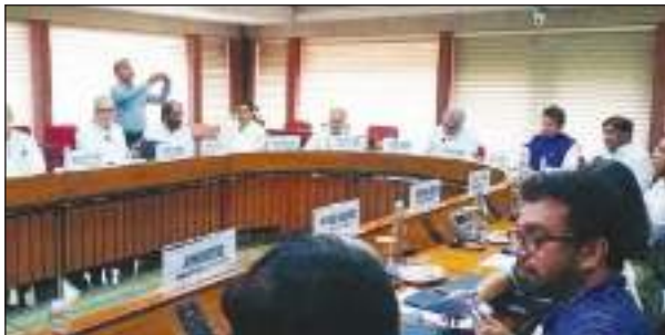
दूरी बनाई, हालांकि बैठक में टीएमसी सांसद मौजूद रहे। अमित शाह ने किया था हिंसाग्रस्त क्षेत्रों का दौरा: मणिपुर में तीन मई से शुरू हुई हिंसा थमने

टीम एक्शन इंडिया/नई दिल्ली मणिपुर में मौजूदा स्थिति पर चर्चा के लिए शनिवार को केंद्रीय गृह मंत्री अमित शाह द्वारा बुलाई गई सर्वदलीय बैठक में भाजपा, कांग्रेस, तृणमूल कांग्रेस और वाम दलों सहित विभिन्न राजनीतिक दलों के नेताओं ने भाग लिया। बैठक में टीएमसी सांसद डेरेक ओ'ब्रायन, मेघालय के मुख्यमंत्री कॉनराड के संगमा, आरजेडी के मनोज झा, पशुपति पारस और सीपीआई (एम) सांसद जॉन ब्रिटानस मौजूद रहे। वहीं ममता बनर्जी और शरद पवार ने इस बैठक से